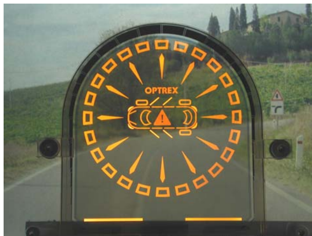
Transparente OLED-Signage-Anzeige.

Optrex Europe GmbH Seligenstädter Strasse 40 64832 Babenhausen Ansprechpartner Dr. Jürgen Wahl Telefon +49 (0) 6073 721 200 Juergen.Wahl@Optrex.de Dr. Siegfried Barth Telefon +49 (0) 6073 721 375 Siegfried.Barth@Optrex.de